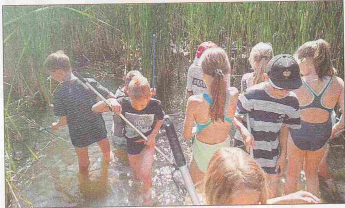
Wir suchen Wassertiere

Am vorletzten Schultag fuhren die Drittklässler nach Olganitz. Im Bungalowdorf startete das Projekt „Teich und Tümpel“. Eifrig suchten die Kinder mit dem Kescher nach vielen verschiedenen Insekten, die dann im Wasserbehälter gesammelt wurden. Anschließend betrachteten die Schüler die kleinen Wassertiere ganz genau mit den Becherlupen und bestimmten den Namen mithilfe der vorbereiteten Kärtchen. Es hatten alle viel Spaß dabei.